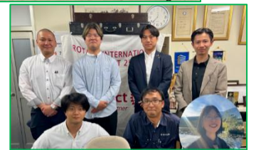
現会員の集合写真