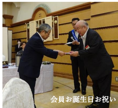
会員お誕生日お祝い