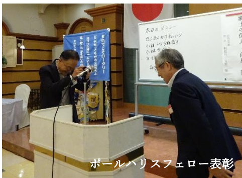
ホールバリスフェロー表彰