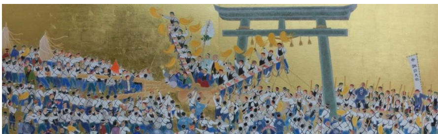
[ 諏訪大社奉納絵 ] (部分)