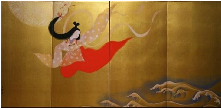
[ 奴奈川姫 ]