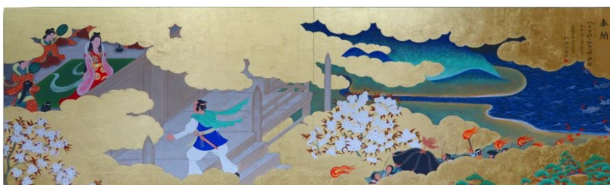
[ 天津神社奴奈川神社奉納絵 ]