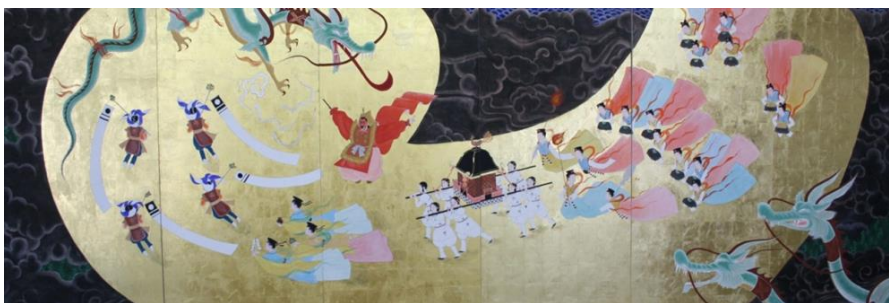
[ 出雲大社奉納絵 ]