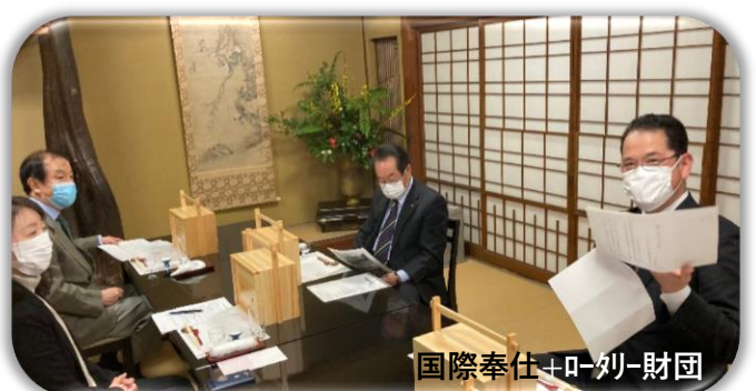
国際奉仕+ロータリー財団