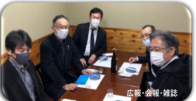
広報・会報・雑誌