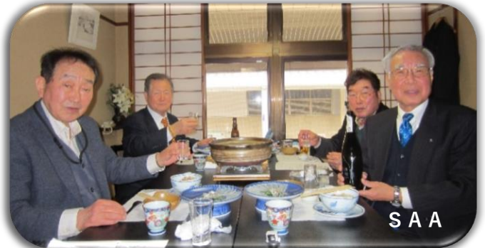
S A A