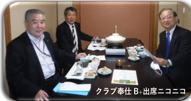
クラブ奉仕 B+出席ニコニコ