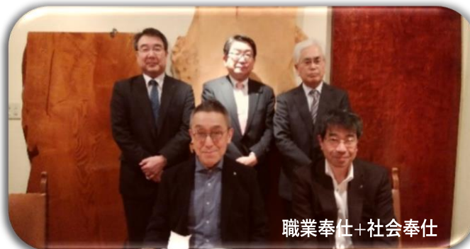
職業奉仕+社会奉仕