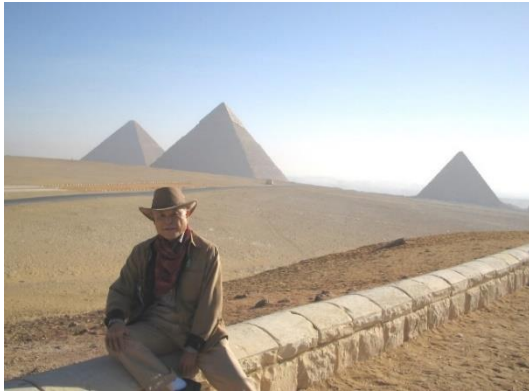
ギザピラミッド群