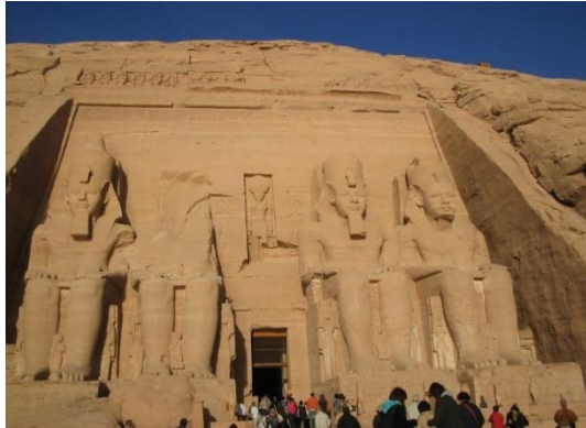
アブ・シンベル大神殿