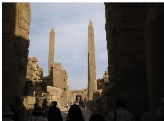
ルクソール 2本のオリバスク