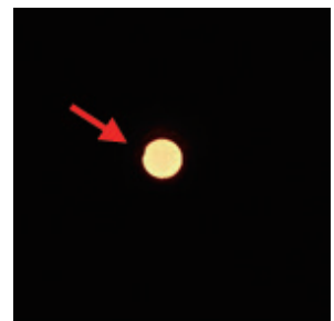
17:58 左上にわずかに月が

みなさん、こんにちは。昨日(6月21日)の部分日食はご覧になりましたか?私は妻から「不審者と間違われぬように」と言われながら約2時間、青田川の土手に腰掛け楽しみました。