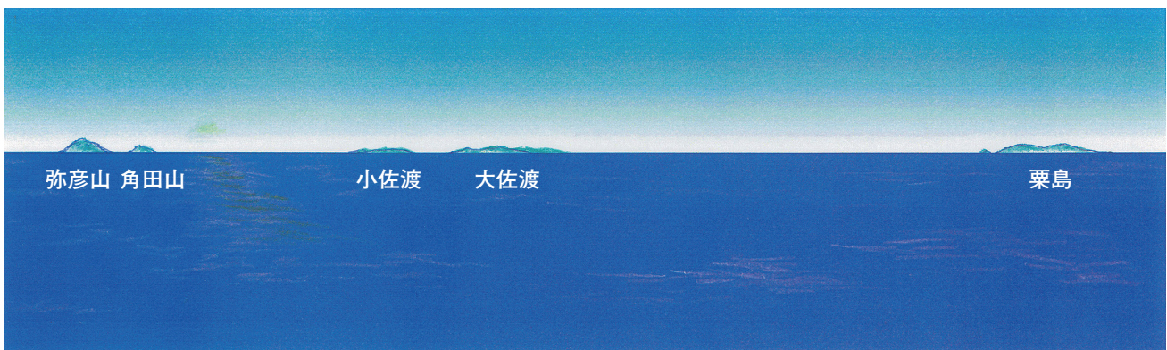
汐美荘から望む(左から)弥彦山、角田山、小佐渡、大佐渡、粟島(イメージ)

今年度は地区内10クラブで周年を迎えます。今回3クラブ目でしたが、来春4月からの7クラブ、どんな新しい仲間、風景と出会えるか楽しみです。