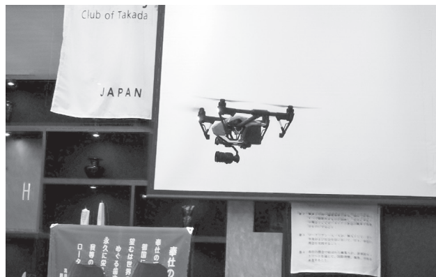
無人ヘリコプター EP