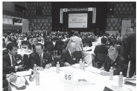
地区大会で真剣にロータリーについて学ぶ!!