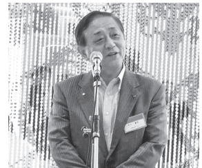
水上会長エレクトによる締め挨拶