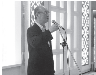
大島 PG による乾杯