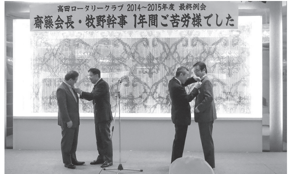
新会長・新幹事へローターバッジの引継